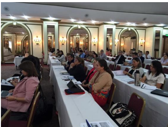
Imágenes de la apertura del taller con postulantes preseleccionados a pares evaluadores de nuevas carreras convocadas.