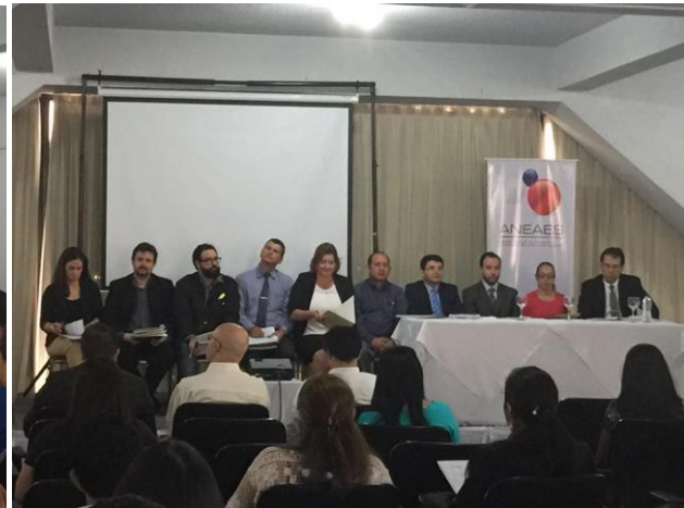
Seminario-Taller de Autoevaluación de los días 8 y 9 de noviembre de 2016.