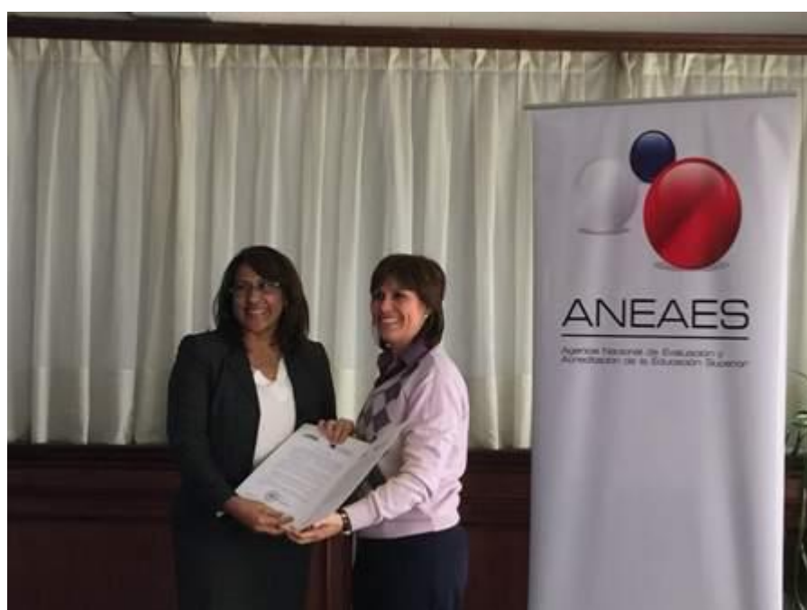
Imágenes de la visita de representante del Consejo Nacional de Evaluación y Acreditación Universitaria de Panamá (CONEAUPA) a la ANEAES.