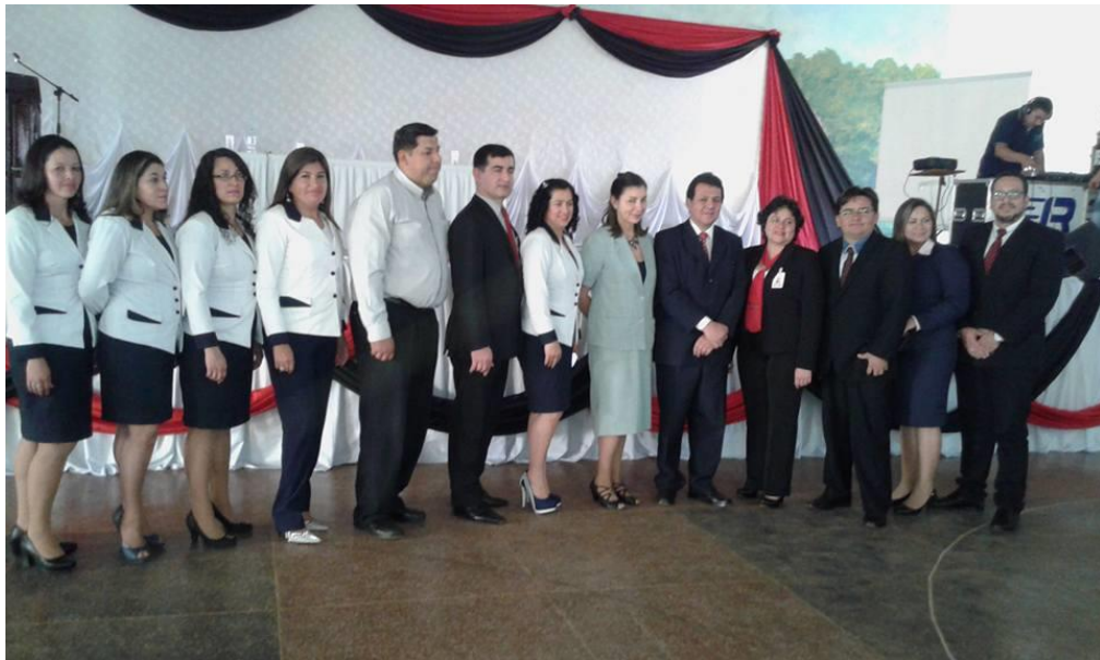
El panelista con los organizadores y el público presente.