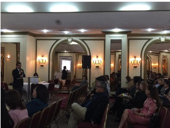
Apertura del primer taller del año. 22/09/16.