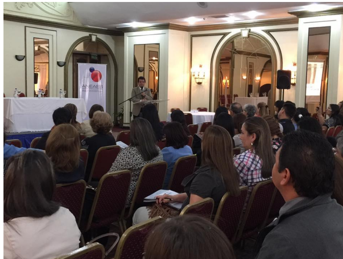
Seminario-Taller de los días 20 y 21 de octubre de 2016.