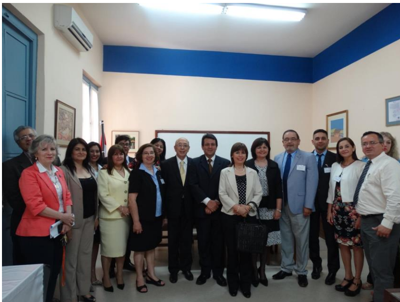
Primera visita de evaluación externa a la Universidad del Cono Sur de las Américas (UCSA). 24/10/2016.