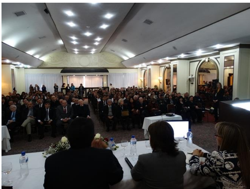
Imágenes del acto de presentación del Programa.

El Programa promoverá el aumento en la cobertura de la evaluación de las instituciones de educación superior (IES), sus carreras de grado y programas de posgrado, con el propósito de garantizar la calidad académica de las mismas.