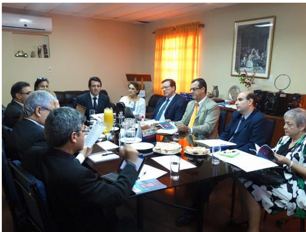
Mesa de trabajo conjunta ANEAES-CONES.