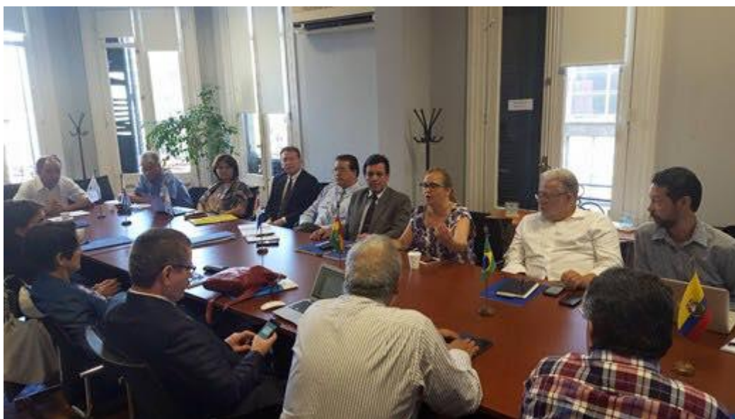
Imágenes de la Reunión de la Red de Agencias Nacionales de Acreditación (RANA) del Sector Educativo del MERCOSUR, realizada en Uruguay.