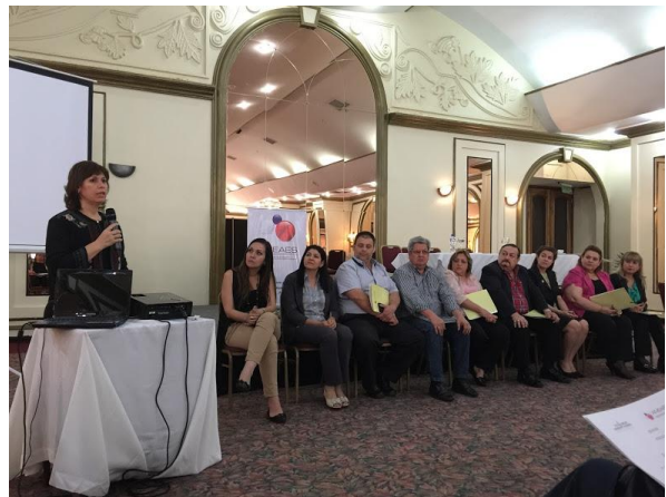
Plenaria general de cierre. 23/09/16.