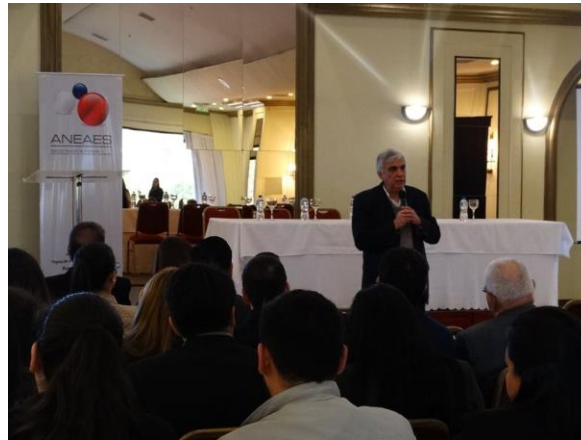
Primer Seminario - Taller del año. 14 y 15 de junio de 2017.