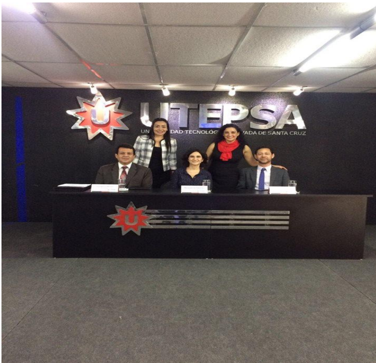
Imágenes del evento, realizada en Bolivia.