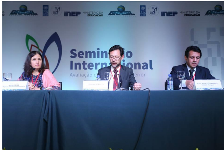
Imagen del Presidente que representó a la Agencia Nacional de Evaluación y Acreditación de la Educación Superior (ANEAES).

efectivo aseguramiento de la calidad de la educación superior en Iberoamérica.