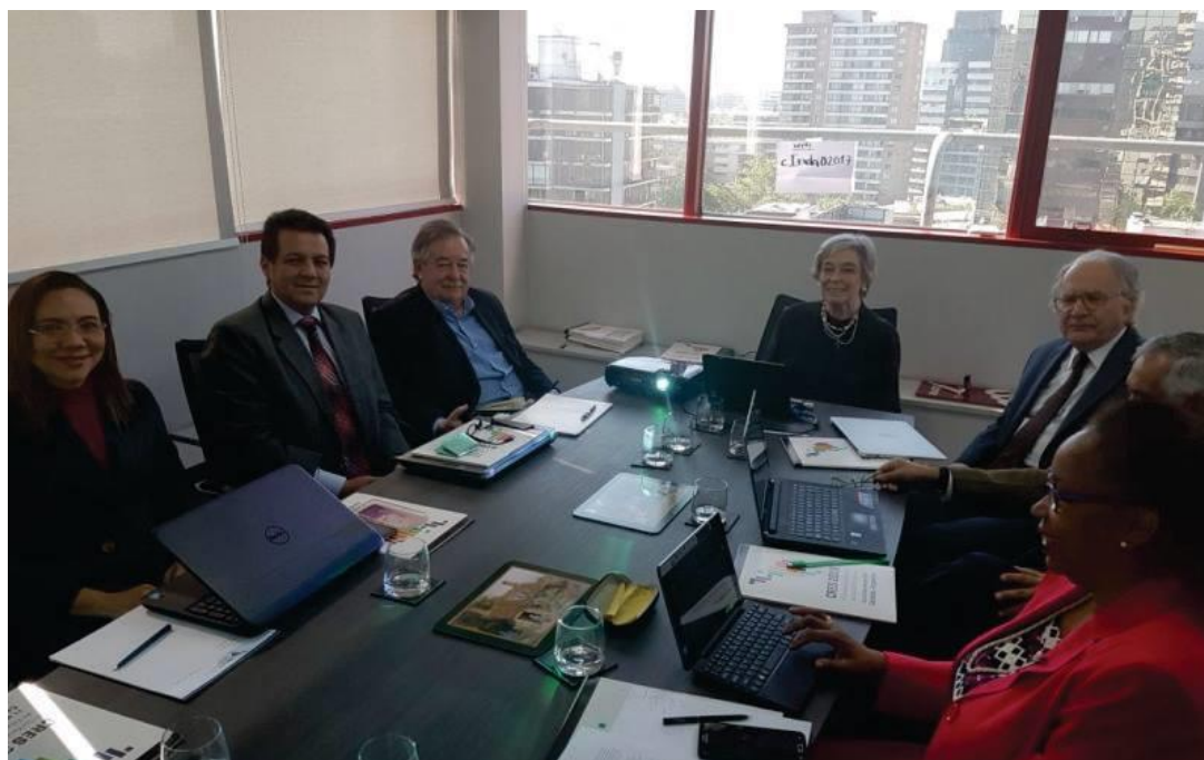
Imágenes de la Reunión del Equipo de trabajo.