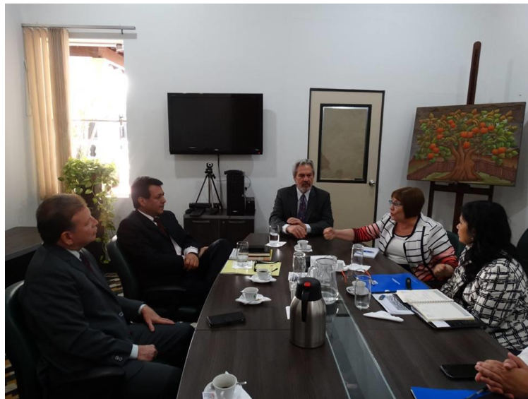
Mesa de trabajo de las autoridades.

En la ocasión, se conversó sobre los lazos interinstitucionales creados con la OEI, así como sobre los aportes en relación a este trabajo coordinado interinstitucionalmente. Asimismo, se delinearon futuros temas de interés mutuo a ser trabajados en el corto y mediano plazo; como ser: el reconocimiento de títulos a nivel regional, la organización de cursos y seminarios sobre experiencias regionales compartidas, el futuro de la formación docente, la necesidad de proyectar una agenda común de diseño de políticas para la educación superior, entre otros.