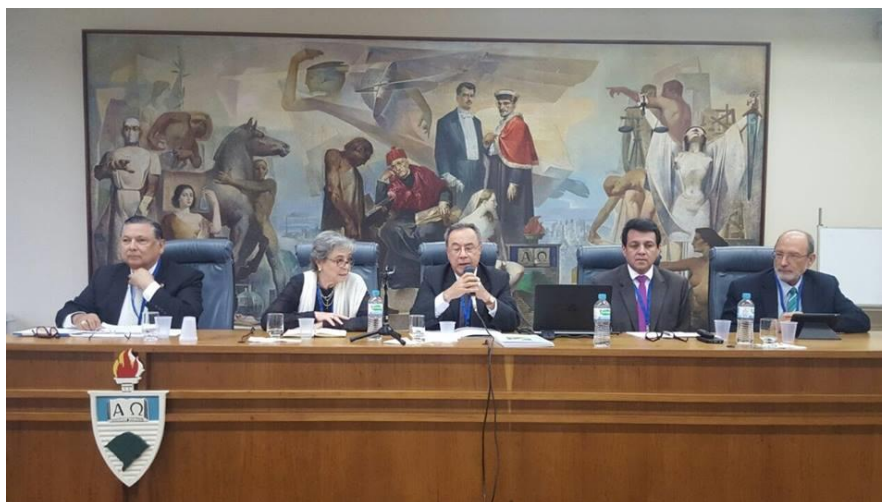
Delegados de la región participaron en el Encuentro de Redes.