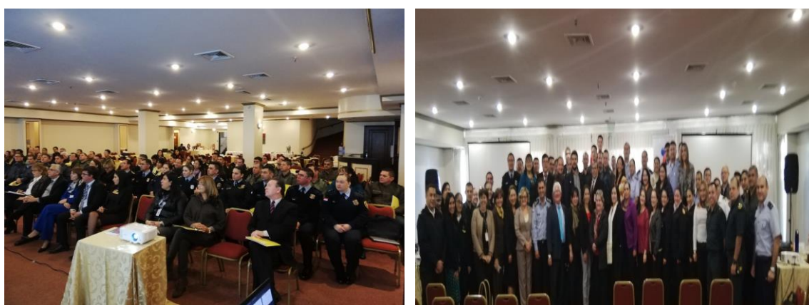
Taller con representantes de IS.

Este taller se llevó a cabo los días 5 y 6 de junio de 2019. El evento se realizó en el Salón Emperatriz II del Hotel Excélsior, desde las 08:00 a 15:45 h, contando con un total de 77 representantes de las instituciones convocadas.