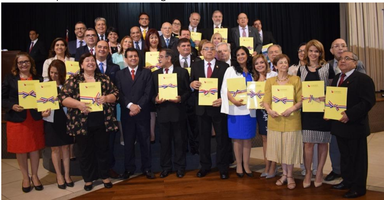
Vista de la entrega de certificados de la ANEAES.

También formaron parte de este importante evento: Directores, Jefes, técnicos y funcionarios de la Agencia.