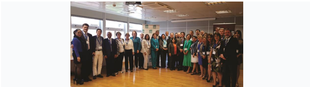
Imágenes del inicio del evento con mesa de autoridades.

Del citado evento participaron representantes de entidades de los diferentes países miembros de la Red, como el Ministerio de Educación Superior, Ciencia y Tecnología (MESCYT) de Rca. Dominicana, INEP de Brasil, Agencia AcreditAcción, Agencia Aespigar S. A, CNED de Chile, CNA de Colombia, SINAES de Costa Rica, CACES de Ecuador, JAN de Cuba, ANECA de España, Quality Certificate Organization de Perú, COPAES, CIEES, CACEI, CONAIC y FIMPES de México, CNEA y CNU de Nicaragua, CONEAUPA de Panamá, ANEAES de Paraguay; así como a los organismos regionales: CACSLA, CINDA, ACAAI, OEI y CCA, entre otros, quienes reflexionaron sobre las acciones y metas de la Red para fortalecer las políticas de aseguramiento de la calidad de la educación superior en los países.